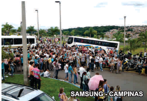
SAMSUNG - CAMPINAS