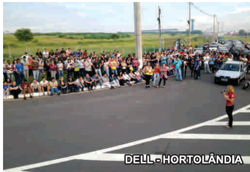
DELL - HORTOLÂNDIA