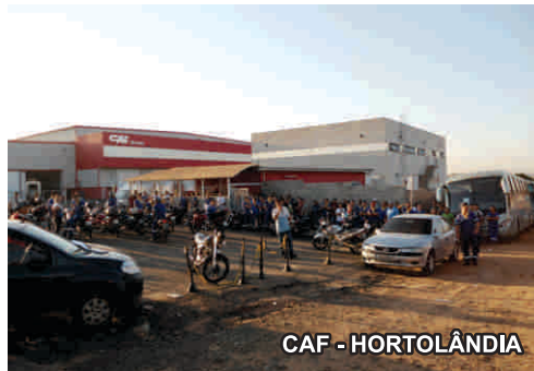
CAF - HORTOLÂNDIA