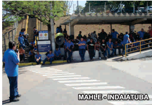
MAHLE - INDAIATUBA