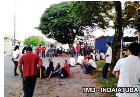
TMD - INDAIATUBA