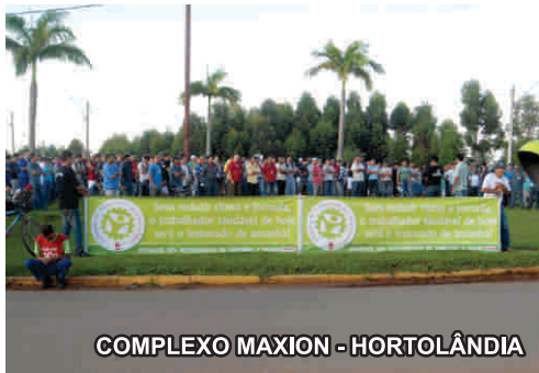
COMPLEXO MAXION - HORTOLÂNDIA