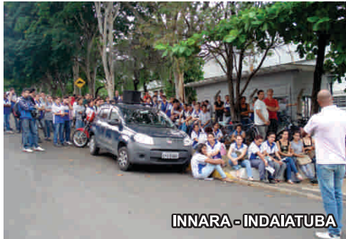
INNARA - INDAIATUBA