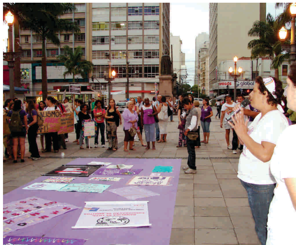
Sindicato participa de ato político no 8 de Março de 2011, em frente à Catedral