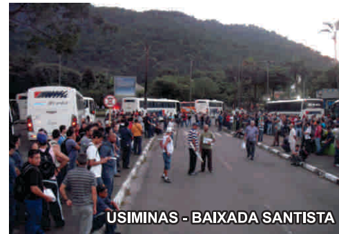
USIMINAS - BAIXADA SANTISTA