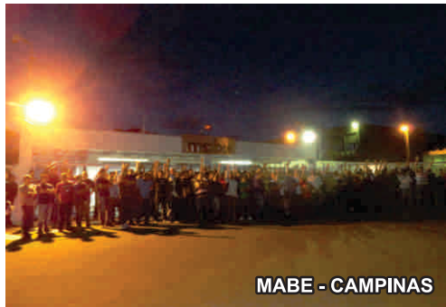
MABE - CAMPINAS

dores morreram em acidente, vítimas das péssimas condições de trabalho. Em luta pela saúde e por segurança nas fábricas, os metalúrgicos da região de Campinas cruzaram os braços Villares, Honda, Dell, Amsted Maxion, CAF, Gevisa, Mabe, Mahle e TMD, Samsung, GKN, Innara, Foxconn e Toyota.