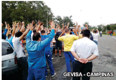
GEVISA - CAMPINAS