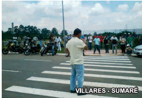
VILLARES - SUMARÉ