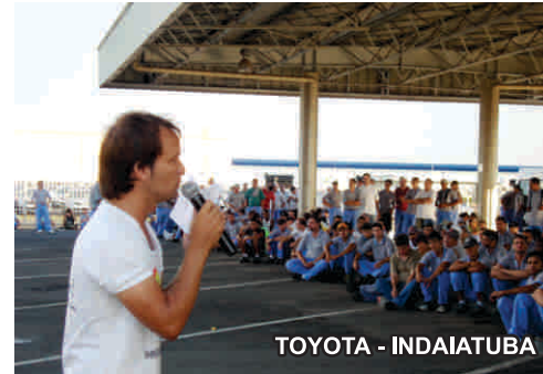
TOYOTA - INDAIATUBA