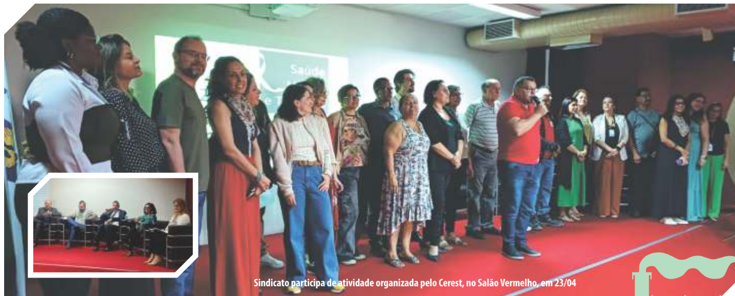
Sindicato participa de atividade organizada pelo Cerest, no Salão Vermelho, em 23/04

No mês de abril, o Dia Mundial da Saúde (7) e o Dia Nacional em Memória das Vítimas de Acidentes e Doenças do Trabalho (28) nos lembram de que é preciso impedir que o trabalho continue esmagando o corpo e a mente dos trabalhadores.