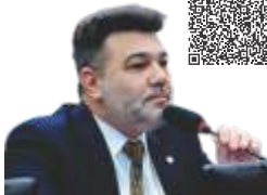
Pastor da Igreja Assembleia de Deus e Deputado Federal

“Quando você estimula uma mulher a ter os mesmos direitos do homem, [...] a sua parcela como mãe começa a ficar anulada”