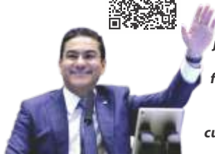
Pastor da Igreja Universal do Reino de Deus e Deputado Federal Marcos Pereira

Enquanto você trabalha mais, recebe menos, e encara a dupla ou tripla jornada, cuidando da casa, dos filhos e dos familiares idosos, eles e os amigos comem bife com ouro que custa cerca de R$ 9 mil, em Nova Iorque